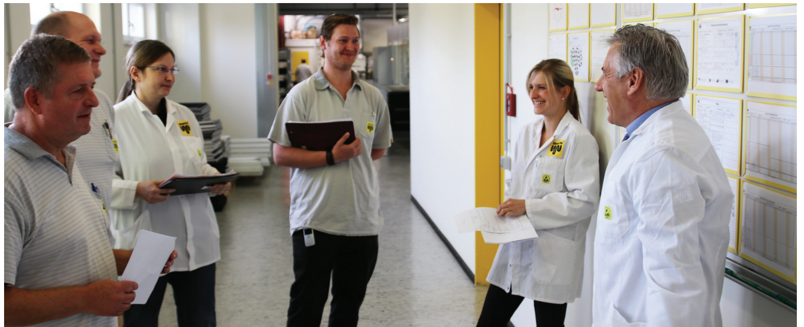
Das „Shopfloor-Team“ freut sich über die positiven Entwicklungen, welche die Entscheidungen der letzten Tage mit sich gebracht haben

Die vielen Zahlen und Grafiken sind der „rote Faden“ für jedes Shopfloor-Meeting.