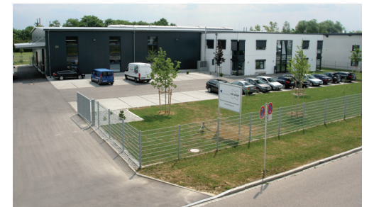
Die rolf weigel GmbH & Co. KG in Gersthofen

Freuen Sie sich schon jetzt auf das nächste straschu Magazin, in wel-