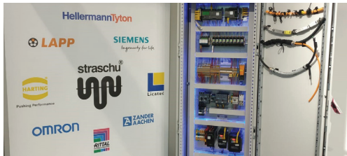
Das Partner-Netzwerk der straschu Elektro-Dystrybcja

Außerdem präsentierte sich die straschu Elektro-Dystrybcja dieses Jahr auf zwei der größten Messen Polens. Zuletzt stellte die straschu Elektro-Dystrybcja auf der „Industry Week“ auf dem „WarsawExpo“ Gelände in Warschau aus. Dies ist die größte Industriemesse in Polen. Aufgrund der großen Auswahl der thematischen Showräume haben die Besucher die Möglichkeit, sich über die Neuheiten und die innovativen Lösungen des Industriesektors zu informieren.