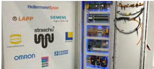
Das Partner-Netzwerk der straschu Elektro-Dystrybcja

Außerdem präsentierte sich die straschu Elektro-Dystrybcja dieses Jahr auf zwei der größten Messen Polens. Zuletzt stellte die straschu Elektro-Dystrybcja auf der „Industry Week“ auf dem „WarsawExpo“ Gelände in Warschau aus. Dies ist die größte Industriemesse in Polen. Aufgrund der großen Auswahl der thematischen Showräume haben die Besucher die Möglichkeit, sich über die Neuheiten und die innovativen Lösungen des Industriesektors zu informieren.