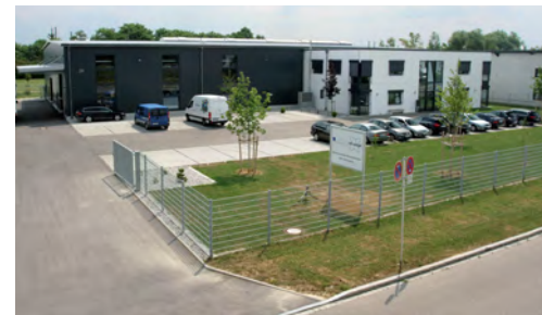
Die rolf weigel GmbH & Co. KG in Gersthofen

Freuen Sie sich schon jetzt auf das nächste straschu Magazin, in wel-