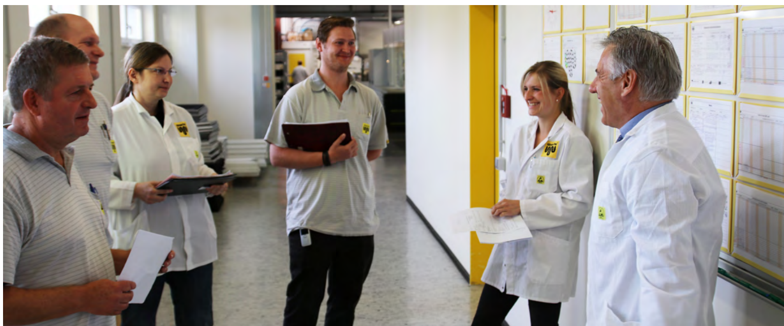
Das „Shopfloor-Team“ freut sich über die positiven Entwicklungen, welche die Entscheidungen der letzten Tage mit sich gebracht haben

Die vielen Zahlen und Grafiken sind der „rote Faden“ für jedes Shopfloor-Meeting.